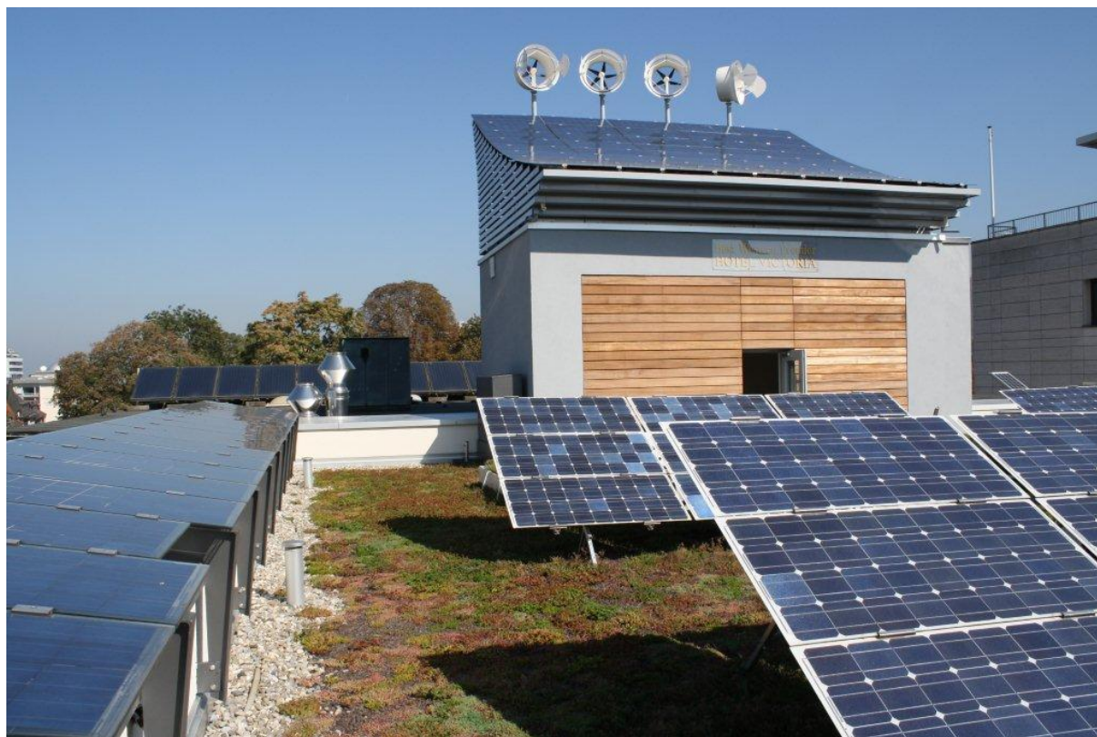
Abb.1: Begrüntes Solardach: Die SFG will sich konsequent für die Förderung des „EnergieGrünDachs“ beziehungsweise für begrünte Solardächer einsetzen.

Die Schweizerische Fachvereinigung Gebäudebegrünung „SFG“ führte am 20. Juni in Kerzers ihre 17. Mitgliederversammlung durch. Rund 30 Mitglieder nahmen teil und profitierten von einem gewinnbringenden Rahmenprogramm.