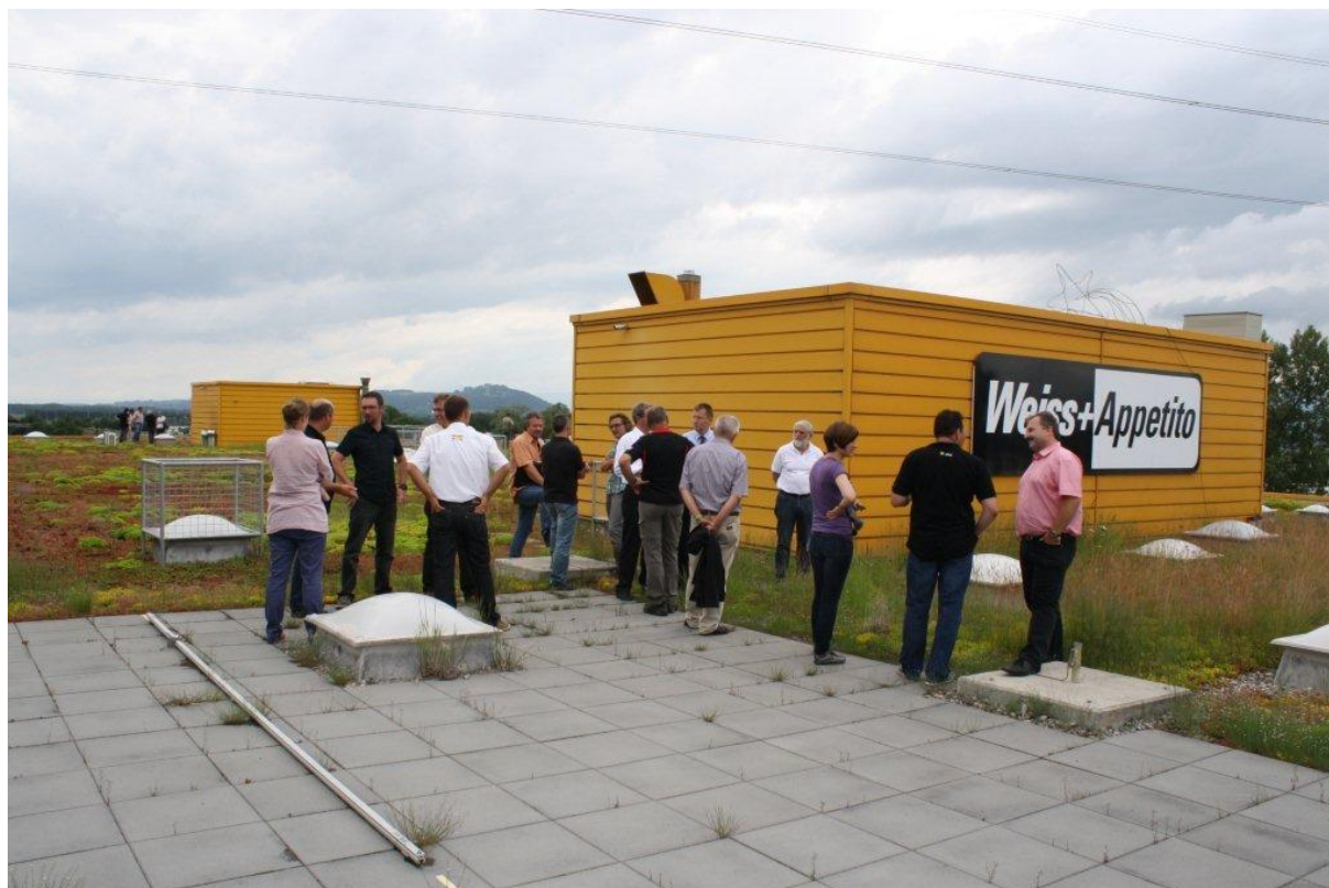
Abb.3: Besichtigung auf dem Dach: Zum vielseitigen Rahmenprogramm der Mitgliederversammlung gehörte auch eine Besichtigung von Gründächern.