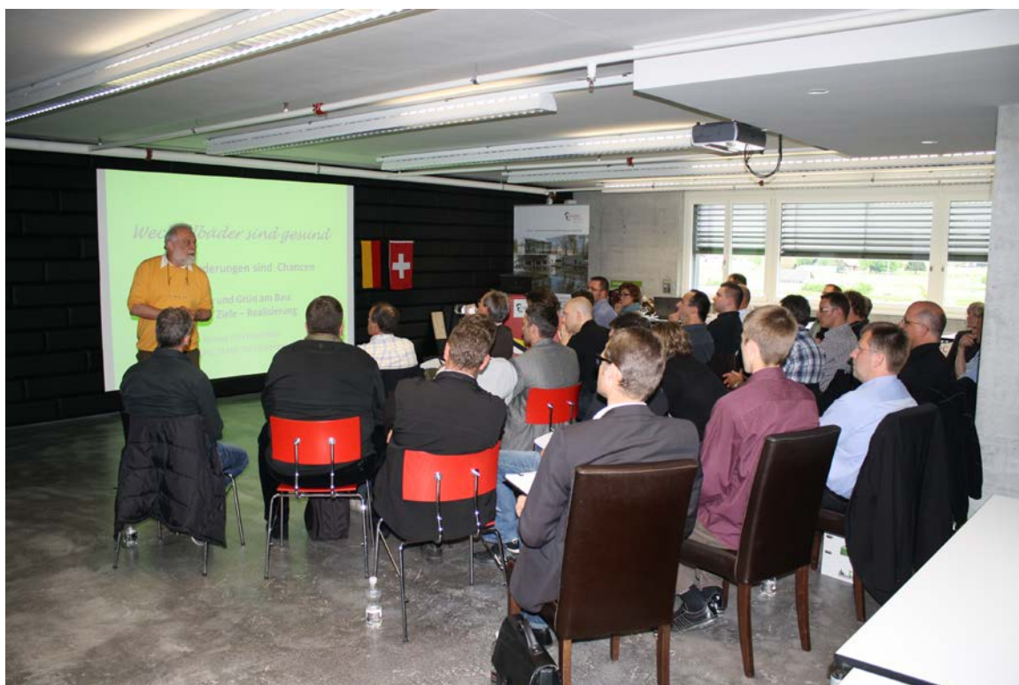
Abb.2: Versammlungssaal mit Teilnehmern: Das Treffen zur Mitgliederversammlung nutzt die SFG jeweils für die Weiterbildung und zur Kontaktpflege der Mitglieder.

Als kleiner Verband hat die SFG seit ihrer Gründung 1996 einiges bewegen können. Mit den Gründach-Richtlinien entstand 1999 erstmals eine qualitative Richtschnur für Extensiv-Begrünungen. Inzwischen sind Dachbegrünungen als ökologische Ausgleichsflächen anerkannt. Gründächer werden zunehmend und recht zahlreich ausgeführt und in den Bauordnungen von Gemeinden auch vorgeschrieben. Voraussichtlich noch in diesem Jahr wird die neue SIA Norm 312 „Begrünung von Dächern“ in Kraft gesetzt, bei deren Ausarbeitung die SFG mitwirkte. Mit der Norm erhält das Gründach endlich auch in der Schweiz eine geregelte und allgemein anerkannte Qualität. Diverse Qualitäts-Anforderungen aus den bestehenden SFG-Richtlinien sind in die neue Norm aufgenommen worden.