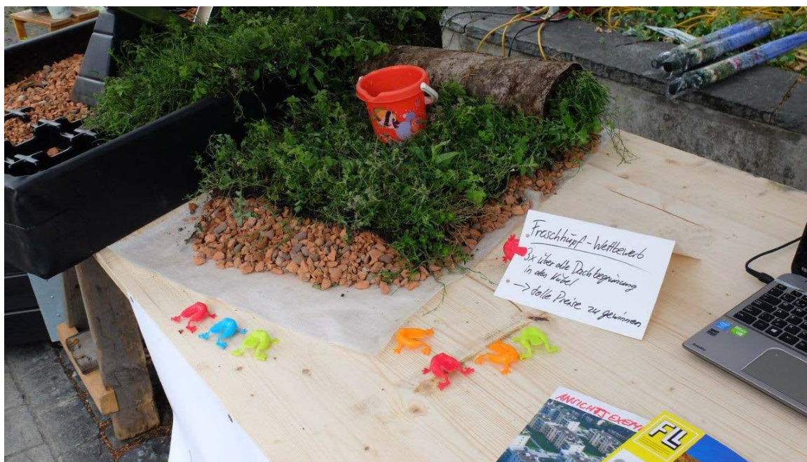
Abb.2: Viel Wissen, Innovation und Spass am SFG-Stand.

Gute Anziehungskraft an den Stand verbreiteten auch die zwei liebevoll bepflanzten Hochbeete (freundlicherweise von der Firma Hauenstein Baumschulen und Gartencenter Rafz zusammengestellt). Mit den Hochbeeten sollte gezeigt werden, dass Frau und Mann auf den Terrassen in Sachen Gebäudebegrünung etwas ausrichten können. Ganz im Trend des Urban Gardenings präsentierten sich die mobilen Hochbeete zum einen mit einer Gemüse/Kräuter Variante und zum zweiten mit Säulenobst und Erdbeeren bepflanzt.